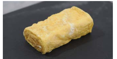
関西型10.5cmを使用し、たまご1個で調理