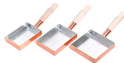
左から：関西型10.5cm、関西型12cm、関東型15cm

長引くコロナ禍で自宅でじっくりと料理を作る機会が増え、ご家庭で本格的な料理を作りたいというお声を聞くことが多くなりました。そこで、これまでふっくら焼き上がることで人気のプロ仕様の銅製たまご焼器を、ご家庭で使いやすい仕様に工夫し、釜浅商店オリジナルの「銅厚手たまご焼器」を開発しました。