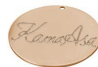
直径3cm ネームプレート イメージ デザインは多少変更となる場合がございます。